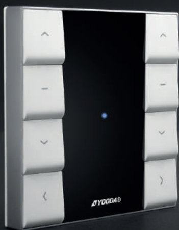
Pilot NUXO 2-kanalowy, biały (NUXO_1x2Rw)